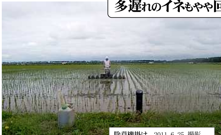
除草機掛け 2011. 6. 25 撮影

3月の震災から5月一杯まで、雨が多く、気温も低い天気が続き、今年の田植えは、遅れに遅れて6月6日にやっと終わりました。