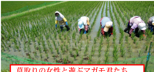
草取りの女性と遊ぶマガモ君たち (女性の前に30羽余りのマガモ)

お陰で、カモ君たちは、私よりも〇さんになつて、草取りに精を出し、ほとんどの雑草を防ぎ、秋には、無農薬の美味しい「あきたこまち」を収穫させてくれました。