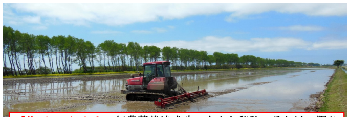
「代（シロ）かき」無農薬栽培成功の大きな秘訣。それは、限りなく平らに代をかき、雑草を防ぐことです。2017. 5. 19 撮影

この影響で、売り上げを伸ばすことだけを動機として有機農業に新規参入する生産者が急増しましたが、彼らは、環境問題などエシカルな理念の追求には、当然、全く興味も関心もない人々が大半でした。