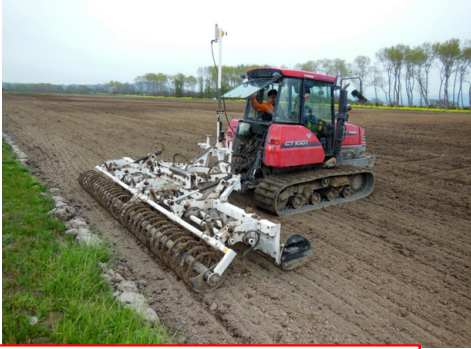
「レベラー作業」レーザー光線付のレベラーで、田面を均一に均す作業。作業機のポールは受光機 2017. 5. 8撮影

我が農舎が農薬や化学肥料を使わないお米作りに転換し始めたのは、今から30年ほど前です。