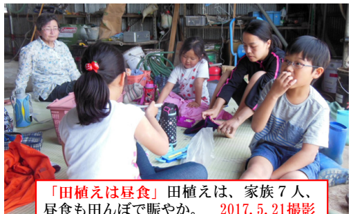
「田植えは昼食」田植えは、家族7人、昼食も田んぼで賑やか。 2017. 5. 21撮影

ところが、最近の不況で一般の消費者は価格の高い物は買わない。また、エシカルな生産姿勢のない生産者には、エシカルな消費者の支援は当然望めず、有機栽培のコストに見合った販売が一時に比べて出来難くなって来た。という事情もあるようです。