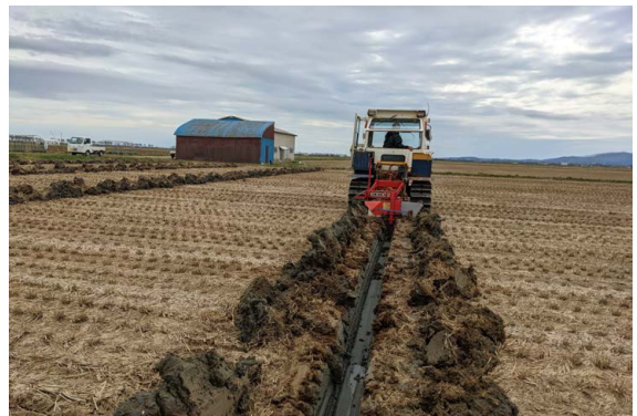
横暗渠の施工風景

この暗渠の費用は全部の田圃で2千万円余り必要で、耐用年数は、10～15年。昨年ほぼ敷設が一巡できたので、今はこの暗渠に直角に、やや浅めに横に暗渠を入れて、無農薬栽培の除草機使用に支障がないよう万全を期しています。有機無農薬栽培は、コスト低減をあくなく求める近代農業とは逆に、手間暇やコストが上がることを厭わない緻密な対応が求められます。